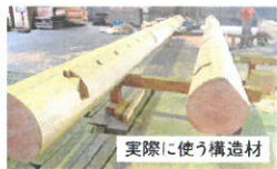
実際に使う構造材

卓袱台を囲んで家族団樂の時を過ごす。今回のご家族のテーマです。隣接する祖父母様の家と行き来出来るということで、シンプルな家をコンセプトに設計しました。家族の笑顔が見える家がいい。こんなお施主様の夢を叶えるために太さ直径40センチ、桁、棟は12メートルの継ぎ目が無い一本物で構造を作り上げています。「迫力の丸太小屋」をぜひご体感ください。